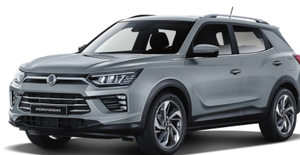
Platinum Gray (ADA)*