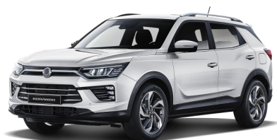
Grand White (WAA)