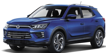
Dandy Blue (BAS)*