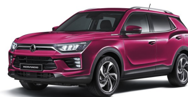
Cherry Red (RAV)*

* Metallic-Lackierung Peinture métallisée Vernice metallizzata