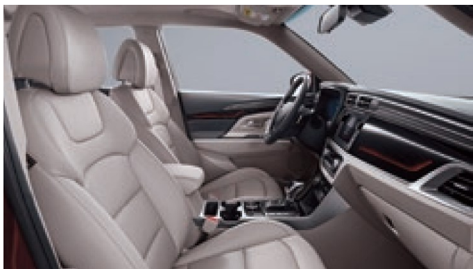
Intérieur Grau–Gris-Grigio / Beige

* Metallic-Lackierung Peinture métallisée Vernice metallizzata