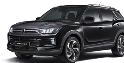
Space Black (LAK)*